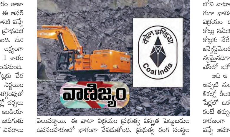
వెలుపడ్డాయి. ఈ వాటా విక్రయం ప్రభుత్వ వినూత్న పెట్టుబడుల ఉపసంహరణలో భాగంగా చేపడతోంది. ప్రభుత్వ రంగ సంస్థ

ముంబయి, మే 26: కోల్ ఇండియా లిమిటెడ్ బుధవారం తాజా ఆఫర్ ఫర్ సేల్ ను ప్రారంభించనున్నట్లు ప్రకటించింది. ఈ ఆఫర్ ద్వారా మొత్తం రూ.5,000 కోట్లు విలువైన షేర్లు విక్రయానికి వచ్చే అవకాశం ఉంది. ప్రతిపాదిత ఓవ్ ఎన్ షేర్ల ప్రభుత్వం ప్రాథమిక ఇబ్బాడు పరిమాణంగా 1 శాతం వాటాను విక్రయించాలి. దీని ద్వారా సుమారు రూ.2,500 కోట్లు సమీకరించాలని లక్ష్యంగా పెట్టుకుంది. అదనంగా గ్రీన్ మా ఆఫ్ షేర్ల ద్వారా మరో 1 శాతం వాటాను విక్రయించి మరో రూ.2,500 కోట్లు సమీకరించనుంది. దీంతో మొత్తం లావాదేవీ పరిమాణం రూ.5,000 కోట్లకు చేర నుంది. షేర్ల కనిష్ట ధరను ఒక్కో షేరుకు రూ.412గా నిర్ణయించారు. మార్కెట్ ధరతో పోలిస్తే సుమారు 10 శాతం తగ్గింపుతో ఉంది. కొన్ని లోబాలుగా ఈ వాటా విక్రయంపై మార్కెట్లో చర్చలు కొనసాగుతున్నాయి. ఈ నెల 25న ప్రభుత్వ వర్గాలు కోల్ ఇండియాలో 2 శాతం ఈక్విటీ వాటా విక్రయనీతి సర్కారులో ఇరుగుతు న్నాయని వెల్లడించాయి. చివరకు మంగళవారం ఆదికారిత వివరాలు