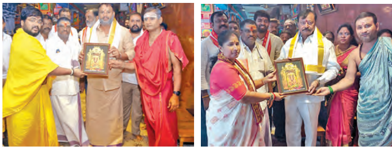
మంత్రి రాంప్రసాద్ రెడ్డి, ఎంపి బిరె పార్లమెంటులో దుర్గమ్మ చిత్రపటం అందిస్తున్న దృశ్యం

విజయవాడ, మే 26 ప్రభాతవార్త: తెలంగాణ డిజిపి సిపి ఆనంద్ సుప్రముఖ రాజకీయ విశ్లేషకుడు, మాజీ ఎమ్మెల్యే ప్రాఫెసర్ నాగేశ్వర కలిశారు. ఆనంతరం మిడియాతో ఆయన మాట్లాడుతూ సామాజిక మాధ్యమాలలో తనపై చేస్తున్న దుష్ప్రచారంపై చర్యలు తీసుకోవాలని డిజిపి కోరినట్లు తెలిపారు. తన వ్యాఖ్యలను ఇప్పటికే ఉపసంహరించుకున్నట్లు చెప్పారు. ఎపీ పోలీసులు ఎలాంటి నోటీసులు ఇవ్వలేదని ప్రాఫెసర్ నాగేశ్వర స్పష్టం చేశారు.