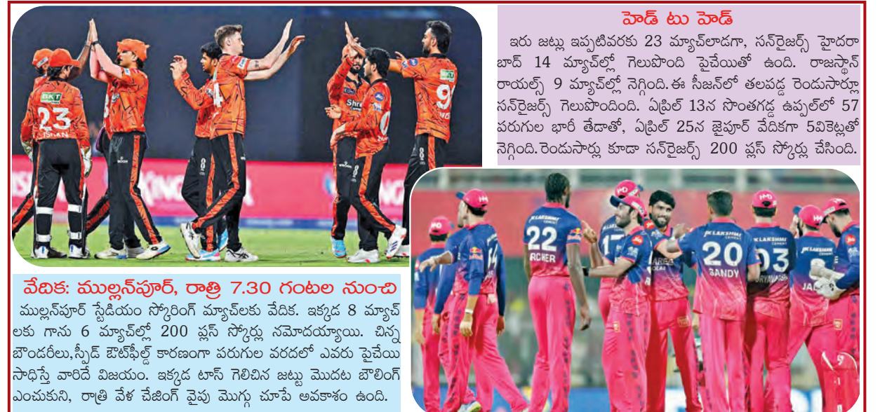
వేదిక: ముల్లన్ పూర్, రాత్రి 7.30 గంటల నుంచి